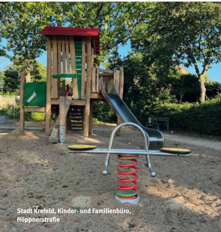
Stadt Krefeld, Kinder- und Familienbüro, Höppnerstraße