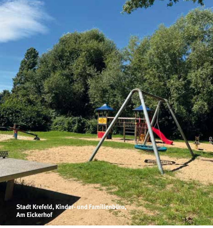
Stadt Krefeld, Kinder- und Familienbüro, Am Eickerhof